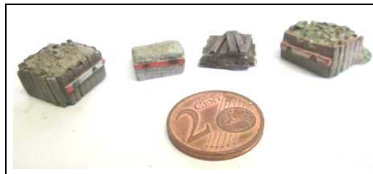
A501 – 4 € Ensemble de 3 heurtoirs et d'un tas de traverses - Modèles monoblocs